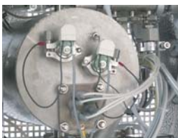
Separated steam generator Separat betriebener Dampferzeuger