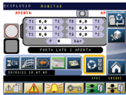
DCS PLUS 10 process controller DCS PLUS 10 Prozesssteuerung